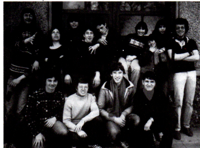
Promotion 1978 - 81

Une réunion de la promotion 1962/65 a lieu au Muséum.