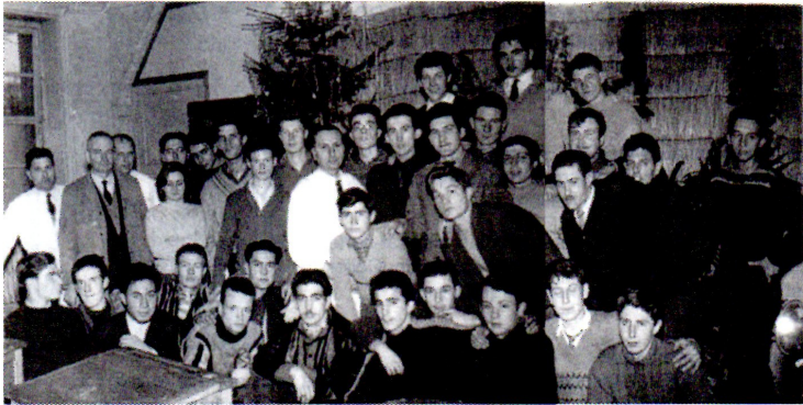
Promotion 1956 - 59

Un stand des Anciens Elèves est présenté, seul stand d'Anciens Elèves présentant l'Ecole et sa formation.