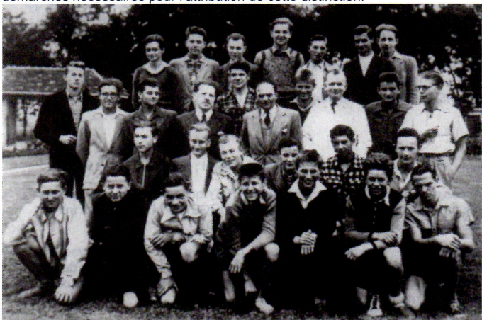
Promotion 1949 - 52