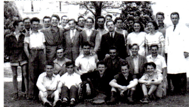
Promotion 1951 - 54

La nouvelle promotion entre dans l'Association dont les deux premières jeunes filles admises à l'Ecole.