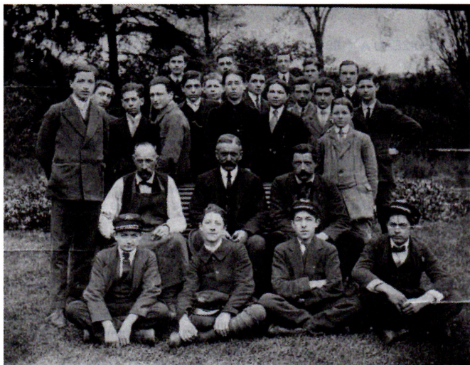
Promotions 1915-18 et 1916-19