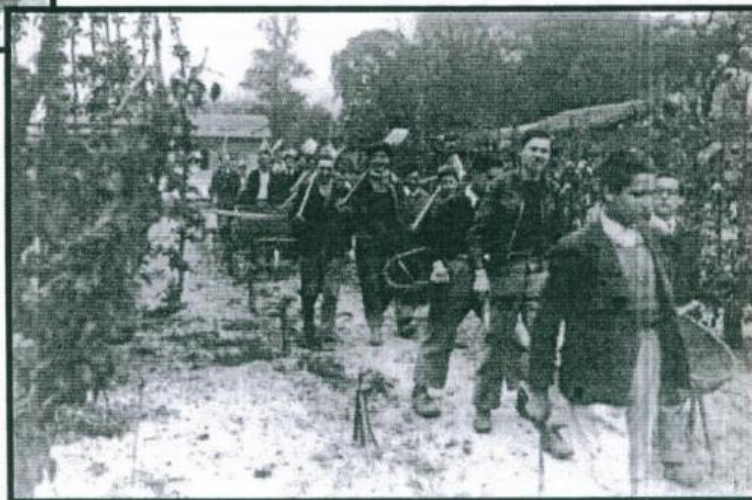
En route vers les T.P.

Dans les années qui précèdent la guerre, aucun événement important n'a lieu, l'École jouit de son autonomie, qui ne lui apporte pas la richesse, mais se développe tout de même lentement.