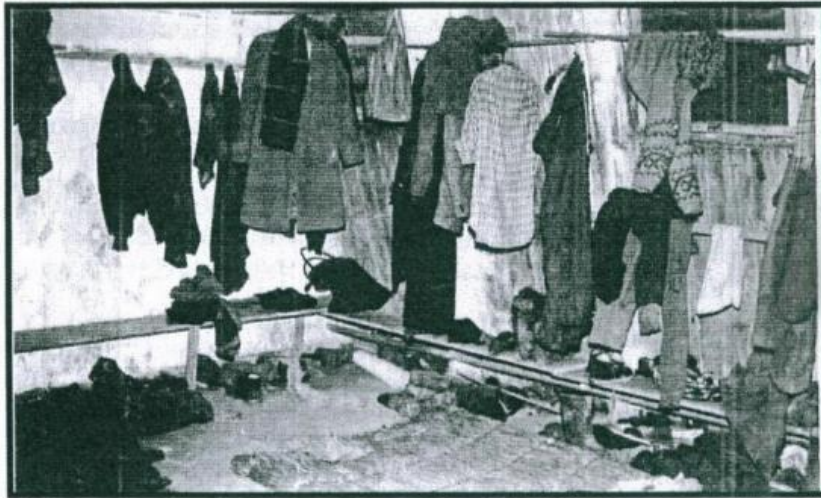
Les vestiaires !