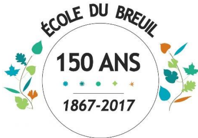
Logo de l'École pour les 150 ans

NB: L'histoire ne s'arrête pas là ! Depuis l'école a continué son long chemin avec de nouveaux départs du personnel en retraite ou vers de nouveaux horizons et de nouvelles arrivées.